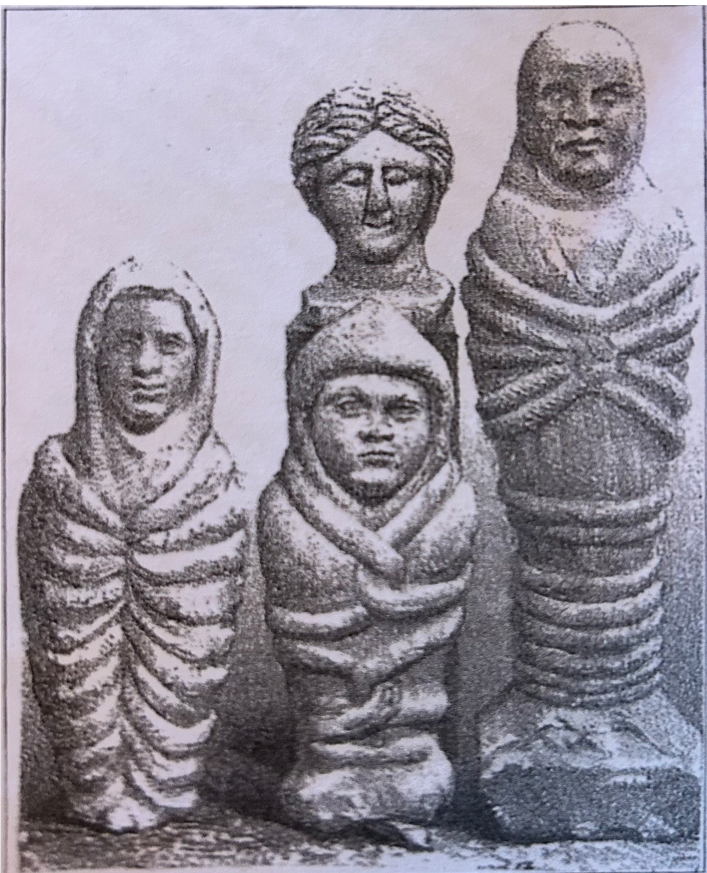
Fig.2: Sainte-Sabine, Ex-voto découverts en 1854 (P. GUILLEMOT, 1861, pl. 1-2-3)

D'après P. GUILLEMOT, en 1861 a été retrouvé quinze à vingt statuette. Ces statuette sont des ex-voto. Les ex-voto représentent des enfants emmaillotés mesurant 35 à 40 cm de haut. Selon J.G BULLIOT, une vingtaine d'ex-voto étaient posés sur des colonnettes dont un portait une dédicace « Bereno Cigtius ». Les ex-voto ont été dispersés dans des collections particulières, mais on en retrouve au Musée d'Archéologie Nationale, au musée d'archéologie de Dijon, de Beaune, d'Autun et au musée d'Alésia.