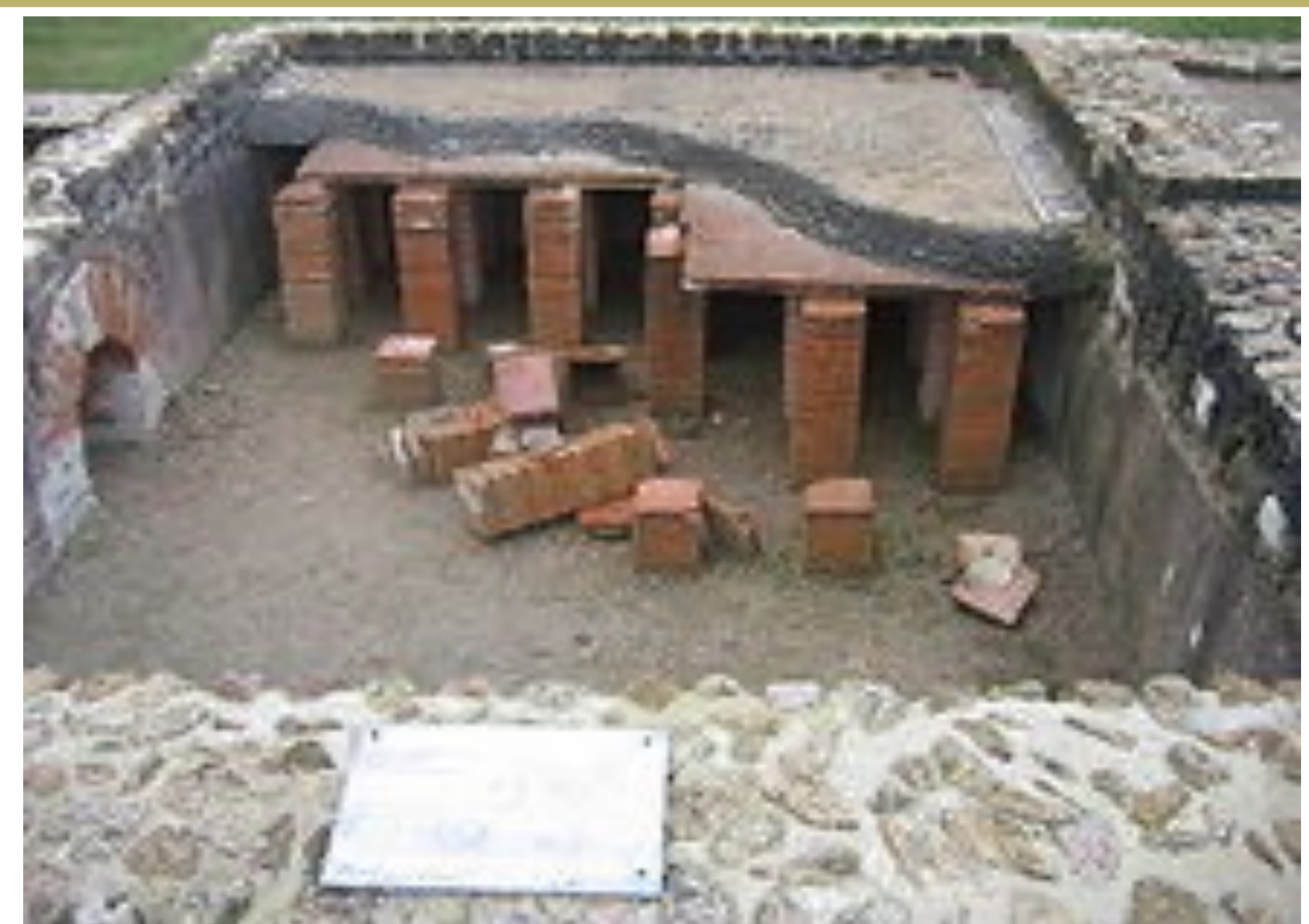
Fig.3: Exemple de salle à hypocauste. Hypocauste de la villa sururbaine de Vieux-le-Romaine, Basse Normandie

Au lieu-dit, Aux Ouches , a été découvert par Pierre NOUVEL grâce à la prospection aérienne une villa gallo-romaine.